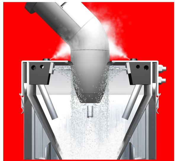
Der Farbzerstäuberreiniger während der Reinigung eines Glockenzerstäubers