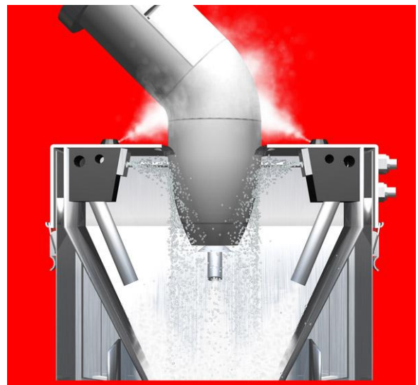
Der Farbzerstäuberreiniger während der Reinigung eines Glockenzerstäubers